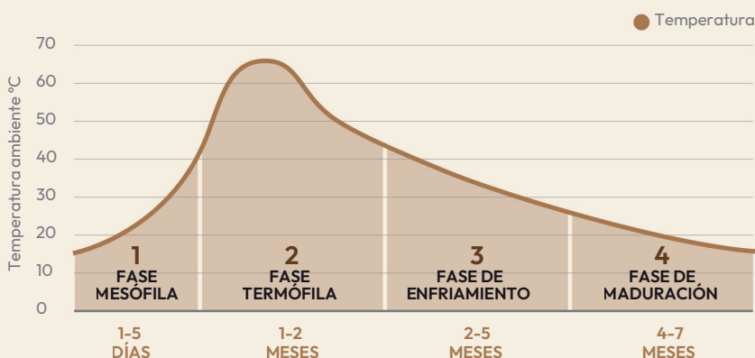
Fases del compostaje

La temperatura irá variando según la fase en la que se encuentre el proceso de descomposición, oscilando entre la temperatura ambiente y los 70°C. Al inicio de la descomposición crece rápidamente, sobre todo si los restos contienen mucho nitrógeno (N), y lentamente irá descendiendo hasta llegar a la temperatura ambiente.